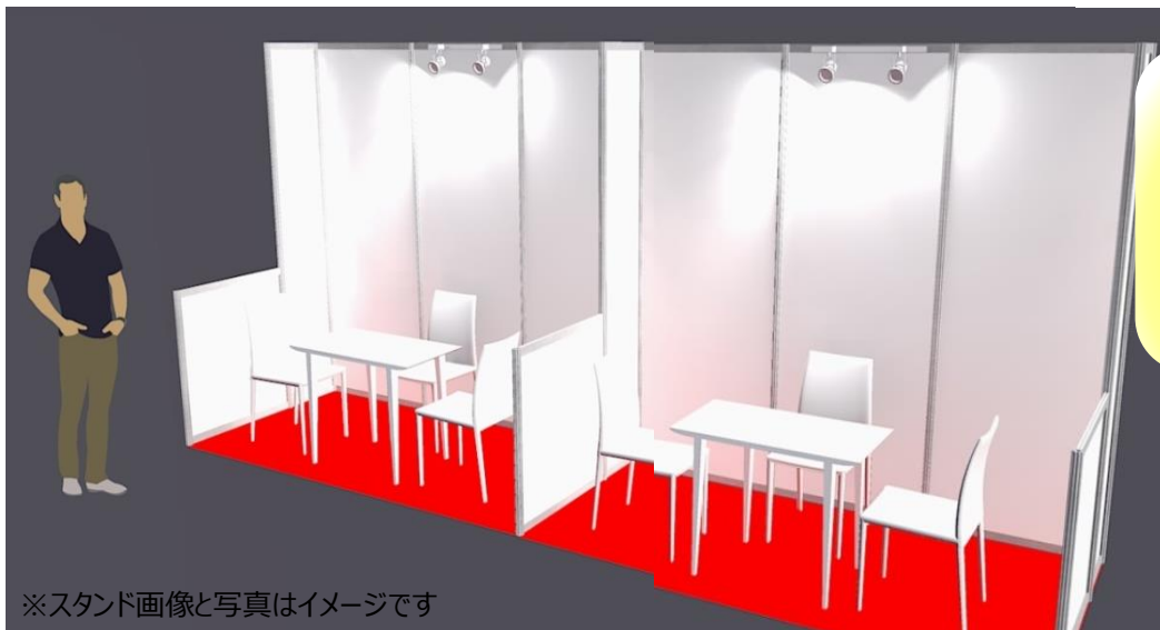
※スタンド画像と写真はイメージです